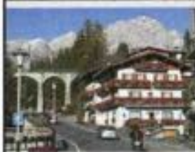
Alcuni scatti panoramici e particolari dal centro di Cortina d'Ampezzo

È lei la Regina delle Dolomiti, Cortina d'Ampezzo, che affascina e ammalia chiunque, circondata dal ricordo dello sfarzo d'altri tempi e che vive tutt'oggi tra i party esclusivi e gli après ski nei luoghi più iconici. Pote da urlo come la Vertigine Bianca oppure la pista Olimpia delle Tofane dove ogni anno le atlete della Coppa del Mondo di sci alpino si lanciano lungo una gola innevata fino a raggiungere i 140 km/h di velocità. Insomma, sfarzo e un po' di follia che ti inebriano la mente. Cortina rimane e rimarrà sempre nel tempo certamente per le sue magnifiche piste da sci ma anche per le numerose proposte culturali durante tutto l'anno. Qualche esempio? Cortinametraggio, Dolomiti Film Festival, Una Montagna di Libri e i numerosi concerti.