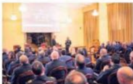
EVENTO «Believe» è stato proiettato ieri nella sede della Squadra Aerea e della Prima Regione Aerea; in alto un momento della presentazione con il generale Biavati (a destra) e il colonnello D'Auria