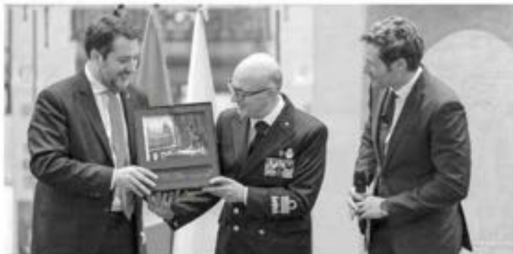
Nella foto: Un momento della presentazione.

Al termine della presentazione, presso la Galleria d'arte "28 Piazza di Pietra", è stata inoltre aperta al pubblico una mostra espositiva delle 12 tavole del calendario, che è rimasa visitabile sino a sabato scorso 7 dicembre.