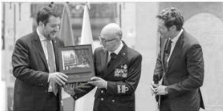
Nella foto: Un momento della presentazione.

Al termine della presentazione, presso la Galleria d'arte "28 Piazza di Pietra", è stata inoltre aperta al pubblico una mostra espositiva delle 12 tavole del calendario, che è rimasa visitabile sino a sabato scorso 7 dicembre.