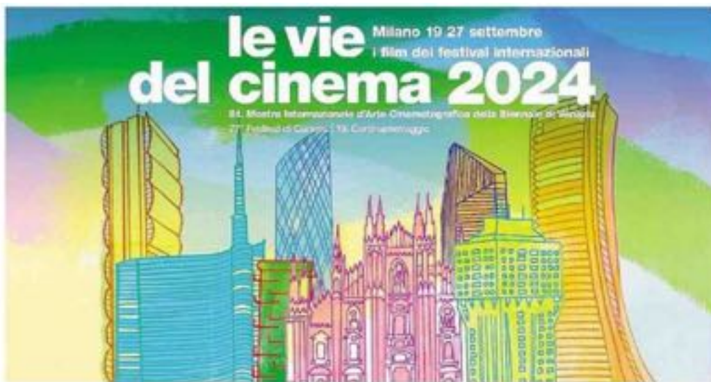
La locandina della manifestazione milanese dedicata ai film dei grandi festival internazionali