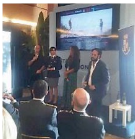
La presentazione al Lido

Inizia con l'incontro fortuito tra Dario, un giovane poliziotto, e Mariano, un anziano malato di Alzheimer, per poi proseguire tra commozione e divertimento che si alternano e finire con i sentiti applausi del pubblico in sala. È stato presentato ieri all'hotel Excelsior all'Italian Pavillion il cortometraggio “Medley”, opera firmata da Santa De Santis e Alessandro D'Ambrosi, prodotta da Piuma Film e Vargo per la Polizia di Stato con protagonisti gli attori Mariano Rigillo e Valerio Morigi e realizzato nell'ambito della collaborazione delle forze dell'ordine con il festival Cortinametraggio.