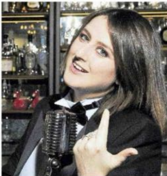
ATTRICE E REGISTA Michela Giraud e la sua travolgente simpatia