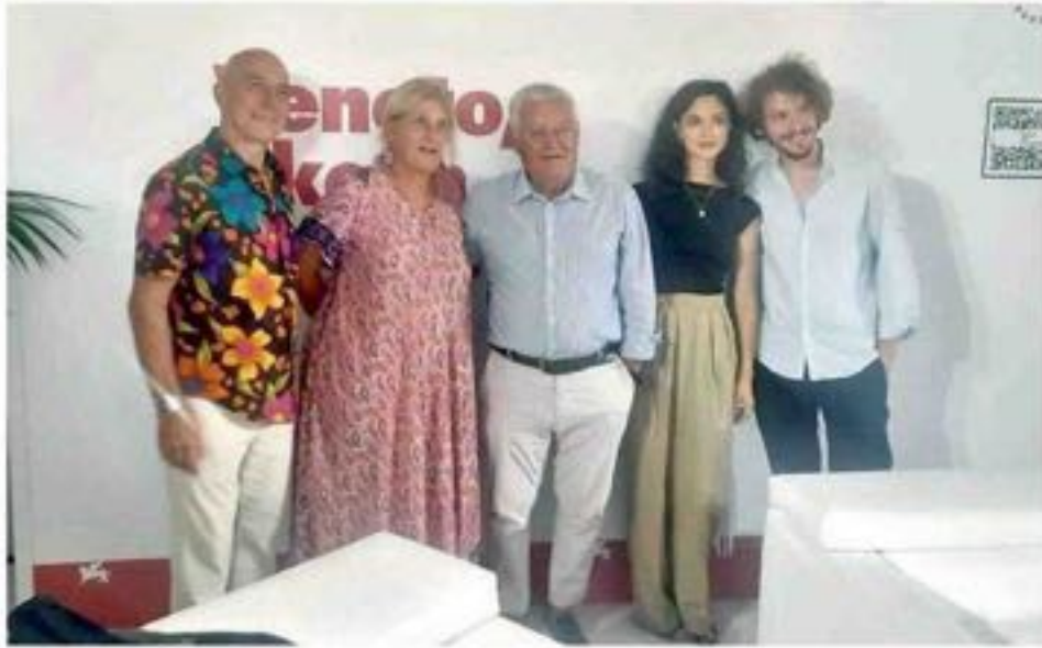
Un momento della presentazione di Cortinamaggio 2025