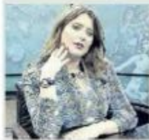
ATTORICE Michela Giraud